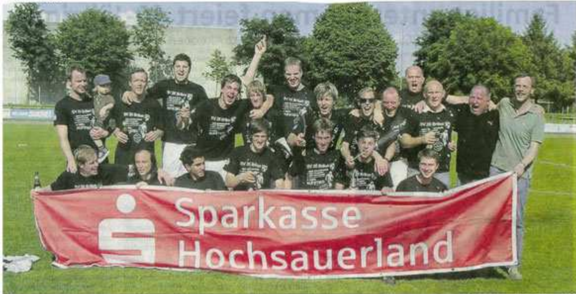
Mannschaft, Trainergespann und Präsidium feiern nach dem entscheidenden 8:0-Sieg am letzten Spieltag gegen Bosporus Marsberg die Meisterschaft und den Aufstieg in die Bezirksliga.