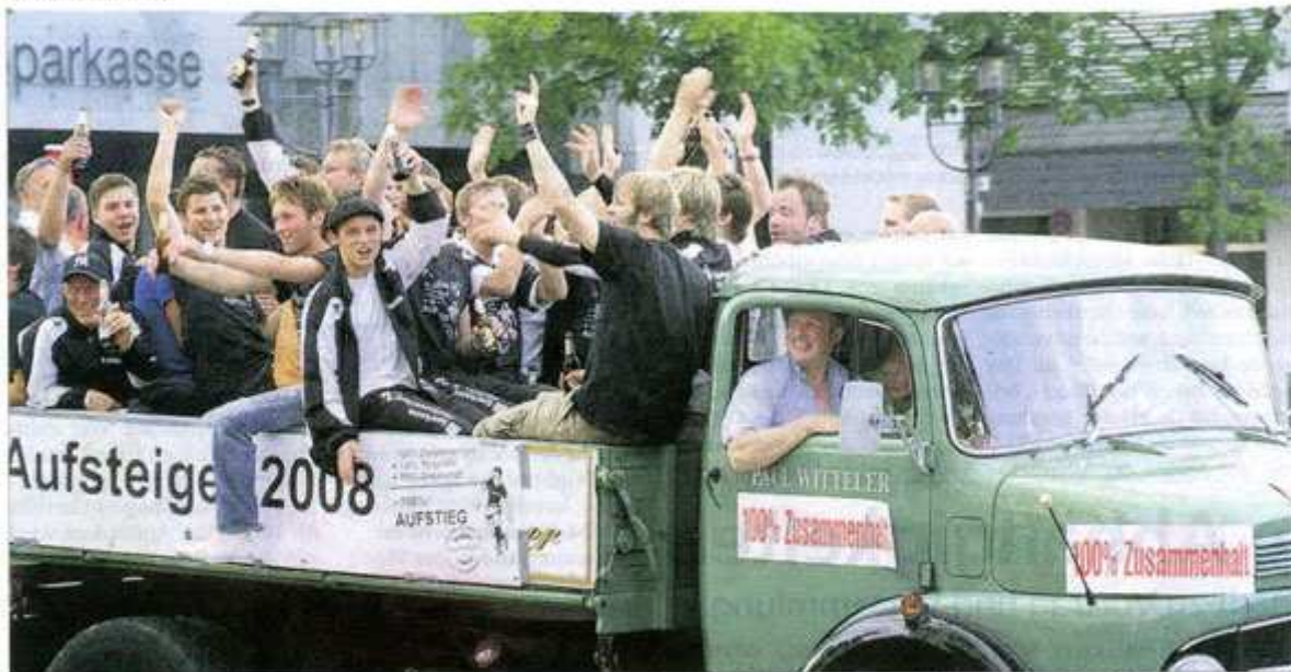
Nachdem die Mannschaft vor über 500 Fans am Stadion an der Jakobuslinde den Aufstieg gefeiert hat, fahren sie mit einem historischen Lkw durch Brilon. Auch am Marktplatz empfangen sie noch einmal jubelnde Fans.