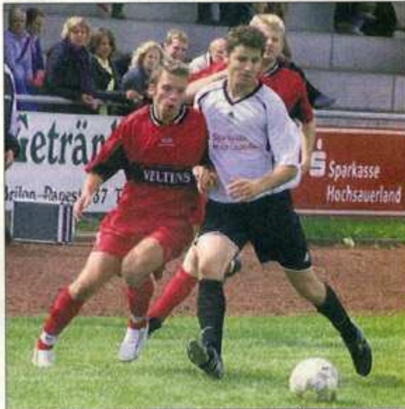
Der SV Brilon machte im Testspiel gegen den SSV Meschede die Räume sehr eng.